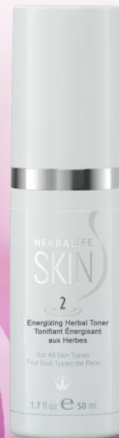
50 mL噴霧瓶 #0767