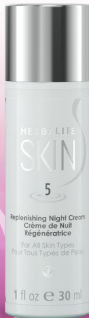
30 mL真空按壓瓶 #0774

† 使用者實驗：使用8小時測量肌膚含水量，100%受試者顯示8小時後肌膚含水量倍增。